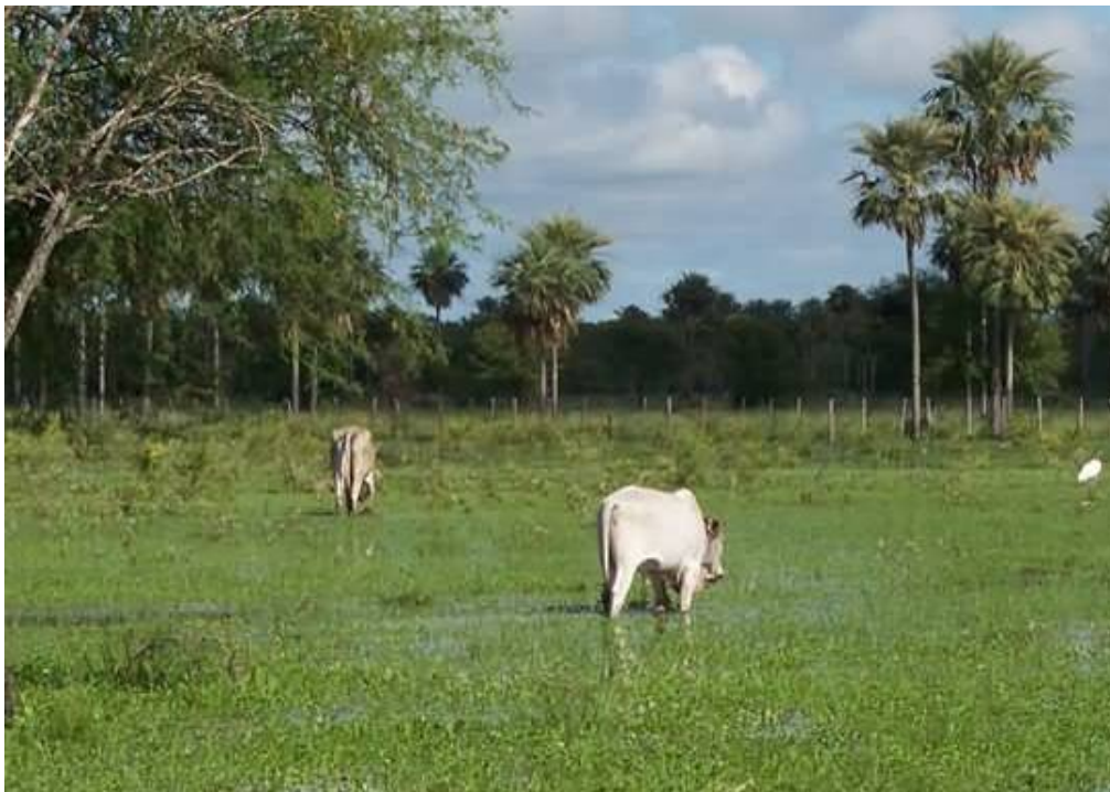
vacuno en tierra inundada

La estancia de ganado vacuno "Los Toros" cuenta con 500 cabezas de ganado y se extiende sobre 9.000 hectáreas.