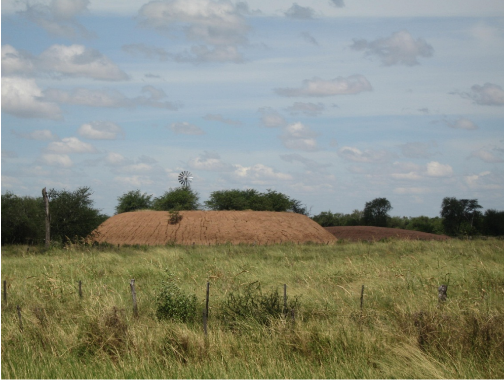
pozo australiano y molino de viento

agronomía + ganadería proyectos realizados